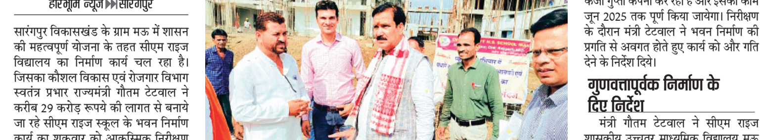
हरिभूमि न्यूज ▶ सारंगपुर

सारंगपुर विकासखंड के ग्राम मऊ में शासन की महत्वपूर्ण योजना के तहत सीएम राइज विद्यालय का निर्माण कार्य चल रहा है। जिसका कौशल विकास एवं रोजगार विभाग स्वतंत्र प्रभार राज्यमंत्री गौतम टेटवाल ने करीब 29 करोड़ रूपये की लागत से बनाये जा रहे सीएम राइज स्कूल के भवन निर्माण कार्य का शुक्रवार को आकस्मिक निरीक्षण किया तथा निर्माण विभाग के अधिकारियों को समय सीमा में गुणवत्तापूर्ण कार्य कराने के निर्देश दिये। मंत्री टेटवाल ने नवीन भवन निर्माण को लेकर जनप्रतिनिधि व अफसरों के साथ जगह का निरीक्षण किया। उन्होंने कहा कि करोड़ों की लागत से भवन का निर्माण किया जा रहा है। इसके बनने से छात्रों को बड़ी सौगत मिलेगी। उन्होंने कहा कि निजी स्कूलों की तुर्ज पर इस स्कूल भवन का निर्माण किया जाएगा। साथ ही सुविधाएं भी निजी स्कूलों की तरह मिलेंगी। टेटवाल ने बताया कि यहां पर शीघ्र सीएम राइज स्कूल भवन का निर्माण पूरा हो इसके लोकर अधिकारियों से चर्चा कर आवश्यक निर्देश दिए गए हैं। नए भवन में क्लासरूम, कंप्यूटर-साइंस लैब, लाइब्रेरी शामिल होगी। जिससे बच्चों को पढ़ाई में बेहतर सुविधाएं मिलेंगी। उल्लेखनीय है कि 29 करोड़ रूपये से सीएम राइज भवन का निर्माण कार्य ठेकेदार