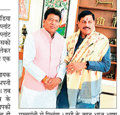
मुख्यमंत्री से मिलूंगा। इसी के तहत आज आष्टा

आष्टा के भंवरी,बागेर क्षेत्र में गेल इंडिया प्लांट लगाने की दी गई स्वीकृति के बाद इस प्लांट में जिन किसान भाइयों की कृषि भूमि को प्लांट हेतु लिये जाने के लिये चिन्हित की गई है। उसको लेकर किसान तैयार नहीं है। इसको लेकर किसानों ने मुख्यमंत्री के नाम एसडीएम को एक ज्ञापन भी सौंपा था।